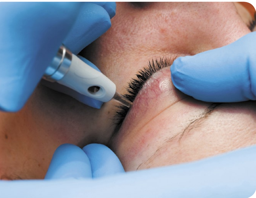
Powieki każdej klientki są inne i wymagają indywidualnej stylizacji